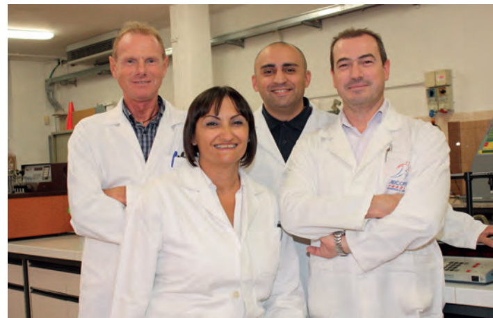
Il team di Ricerca & Sviluppo di Axtrolab